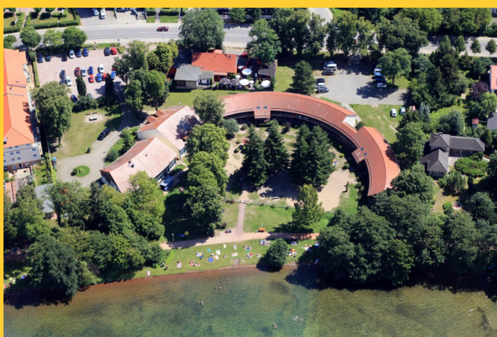
Abbildung 3: DJH Wandlitz mit Strandabschnitt

Wer länger bleiben will oder früher anreisen, möge dies bitte bei den Kommentaren während der Online-Anmeldung vermerken.