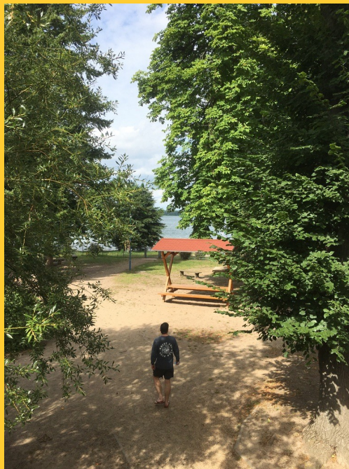
Abbildung 7: Ufer des Sees an der DJH