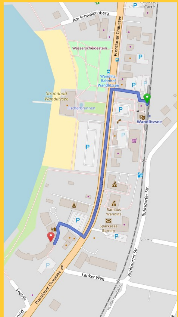
Abbildung 5: Fußweg vom Bahnhof zur DJH

Der Bahnhof Wandlitzsee ist 300m von der Jugendherberge entfernt.