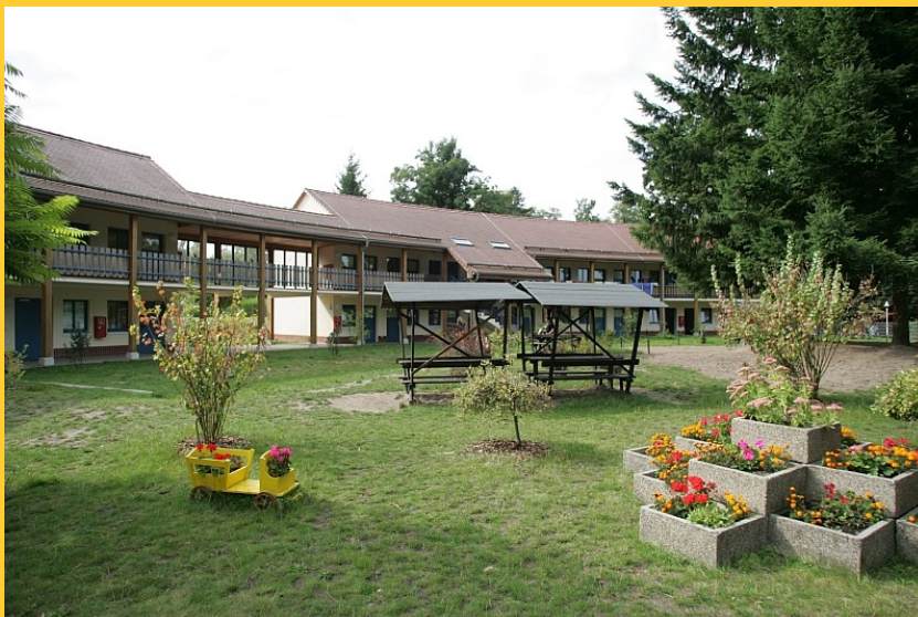
Abbildung 4: DJH Wandlitz

Wer mit dem Wohnmobil anreist oder campen will, kann auf einem der umliegenden Campingplätze übernachten (Ab 3km Entfernung). Auch darüber gibt es auf der im Absatz darüber genannten Webseite Informationen.