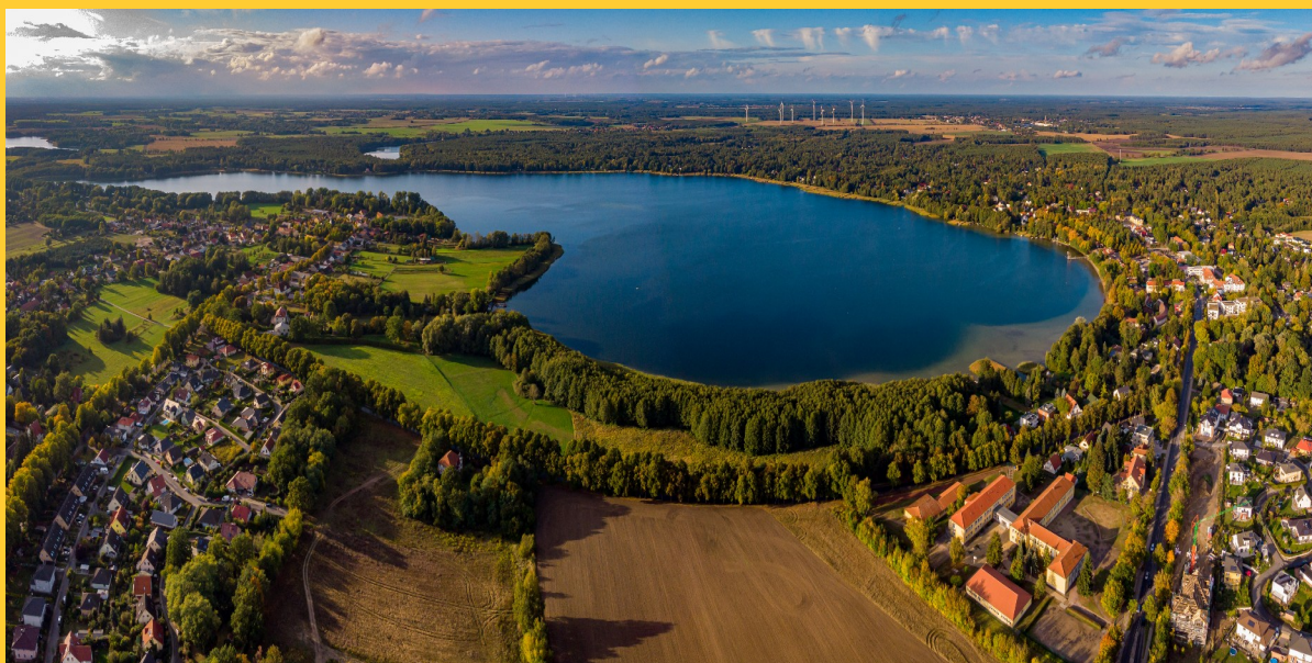
Abbildung 2: Wandlitzer See

Der Ort wirbt mit den Worten: „Herrlich nach Kien duftende Wälder, glasklare Seen und idyllische Rückzugsorte für Seele und Gemüt, fernab von Trubel und Hektik des Alltags. Wandlitz zieht mit Charme und Gastfreundlichkeit fast alle in seinen Bann. Eine Schatzkiste, voll mit kleinen und großen Schätzen.“