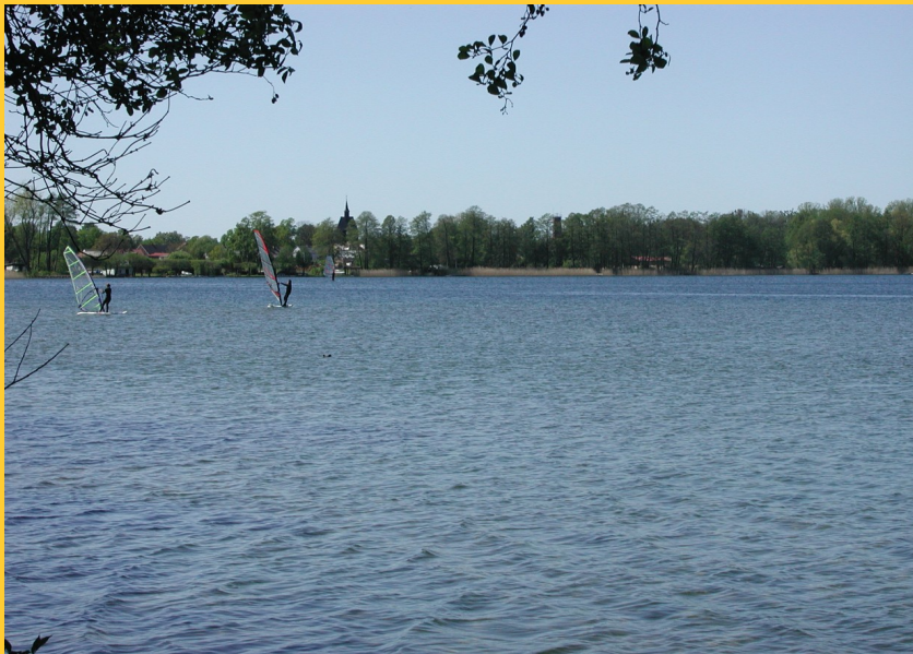
Abbildung 8: Blick vom See auf das Dorf