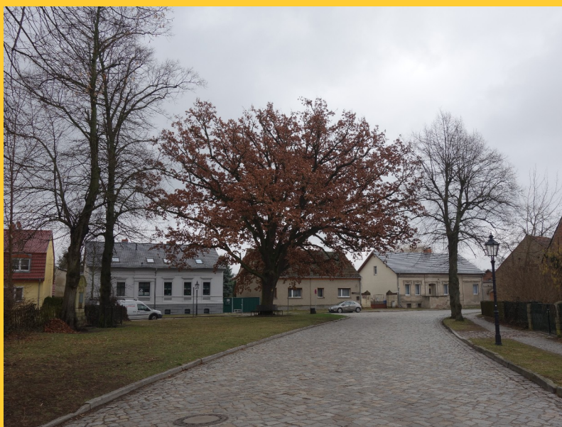
Abbildung 6: Friedenseiche im Märkischen Dorf