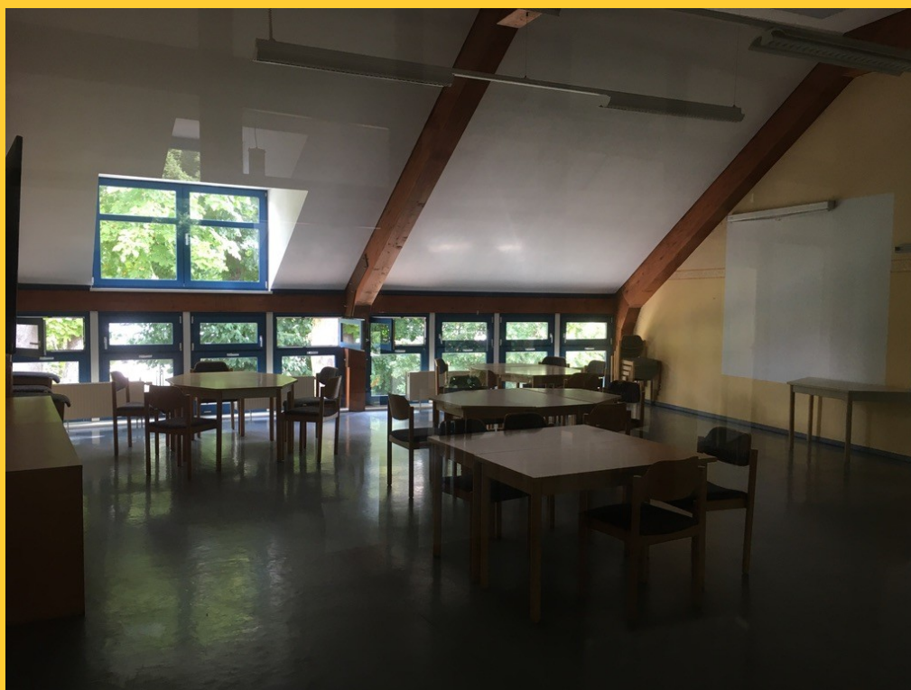
Abbildung 1: Versammlungssaal in der Jugendherberge